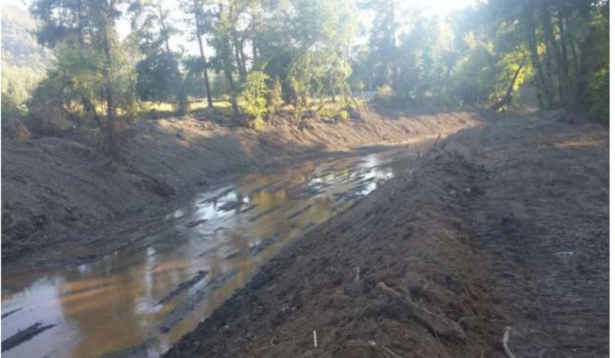
Fotoğraflar 14 - 15 : Ekskavatör ile yapılan ıslah çalışmasının öncesi-sonrası