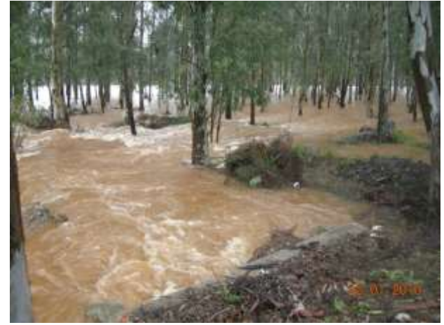
Fotoğraf 1-2-3-4: Bölgede 2010 yılında yaşanan taşkın görüntüleri

Marmaris İlçesi Hisarönü Mahallesi, turizm açısından önem arz eden yerleşim yerlerinden birisidir. Bu nedenle yöre halkının İdaremize talebi üzerine, Kazan Deresi taşkınlarının önlenmesi amacı ile dere güzergâhı boyunca kalıcı bir ıslah çalışması yapılması için istikşaf çalışmaları yapılmış ve uygulama projeleri hazırlanmıştır. İdaremizce kalıcı ıslah çalışmasının yapılabilmesi için, “Akarsu ve Dere Yataklarının Islahı” konulu 2010/5 sayılı Başbakanlık Genelgesi gereği, İlgili Belediyesince ıslah güzergâhının kamulaştırma sorunu çözülmüş bir şekilde İdaremize teslim edilmesi gerektiğinden, Muğla DSİ 213. Şube Müdürlüğümüzce, Muğla Büyükşehir Belediyesine yer teslimi ile ilgili 08.04.2015 tarih ve 215181 sayılı yazı yazılmış ve yer tesliminin sağlanması istenmiştir. Zira; hazırlanan projeler neticesinde kalıcı ıslah tesisi güzergâhında (2 adet yan kol ile birlikte) 26.286,57 m 2 kamulaştırma gereklidir. Kalıcı ıslah tesisinin yapılması için kamulaştırma sorununun çözümlenerek, yer tesliminin yapılması beklenmektedir. Yer teslimi yapıldıktan sonra iş İdaremiz Yatırım Programına alınacak ve yapımı gerçekleştirilecektir.