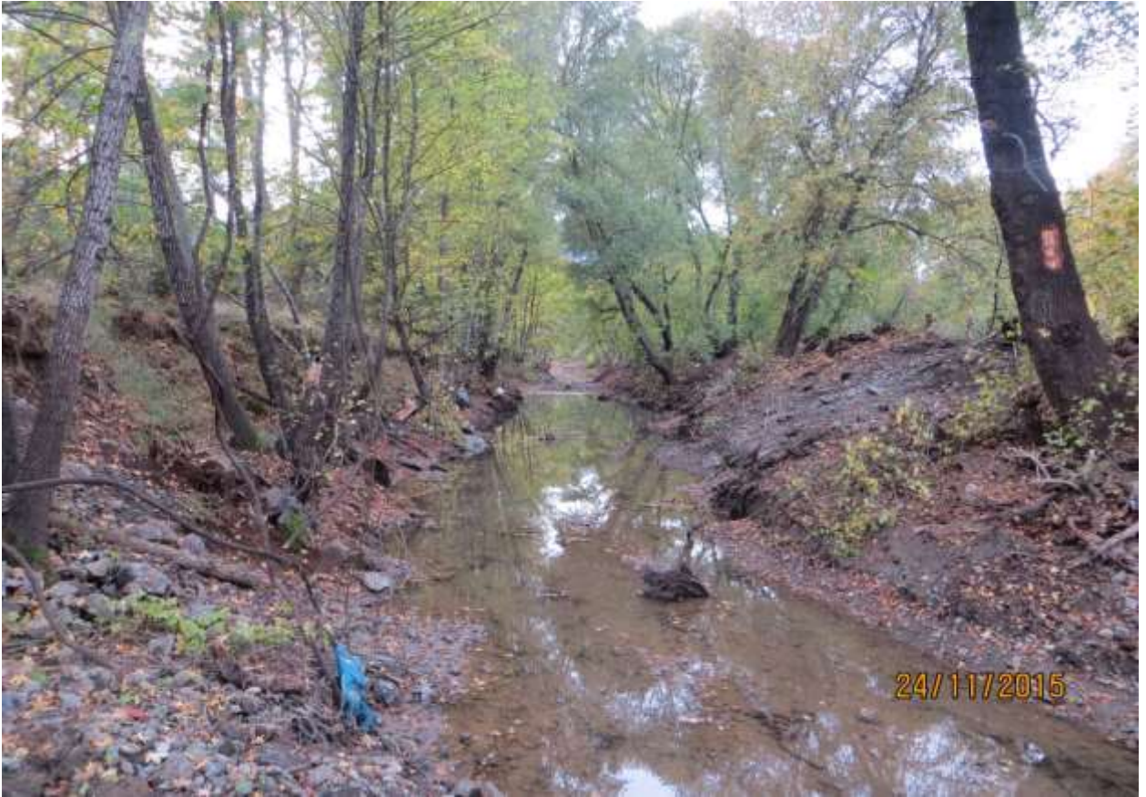
Fotoğraflar 12-13 : Ekskavatör ile yapılan ıslah çalışmasının öncesi-sonrası