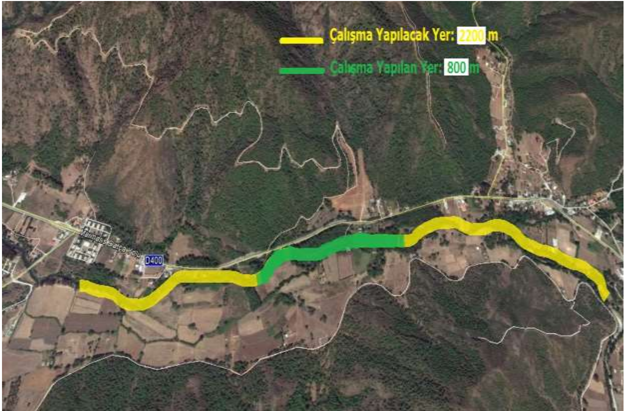
Uydu Fotoğrafı Görüntüsü-3 : Ekskavatör ile yapılan/yapılacak çalışma güzergahı

Akabinde, 2016 yılı Eylül ayı içerisinde Marmaris Orman İşletme Müdürlüğü tarafından, Kazan Deresi'nde ıslahı yapılmadan kalan güzergâhtaki " dere yatağı içerisinde bulunup, kesiti daraltan ve akış rejimini bozan " ağaçların kesilmesine müteakip İdaremizce makineli (ekskavatör) ıslah çalışmalarına yeniden başlanmıştır. Hâlihazırda da bölgedeki çalışmalarımız devam etmektedir. (Uydu Fotoğrafı Görüntüsü-3)