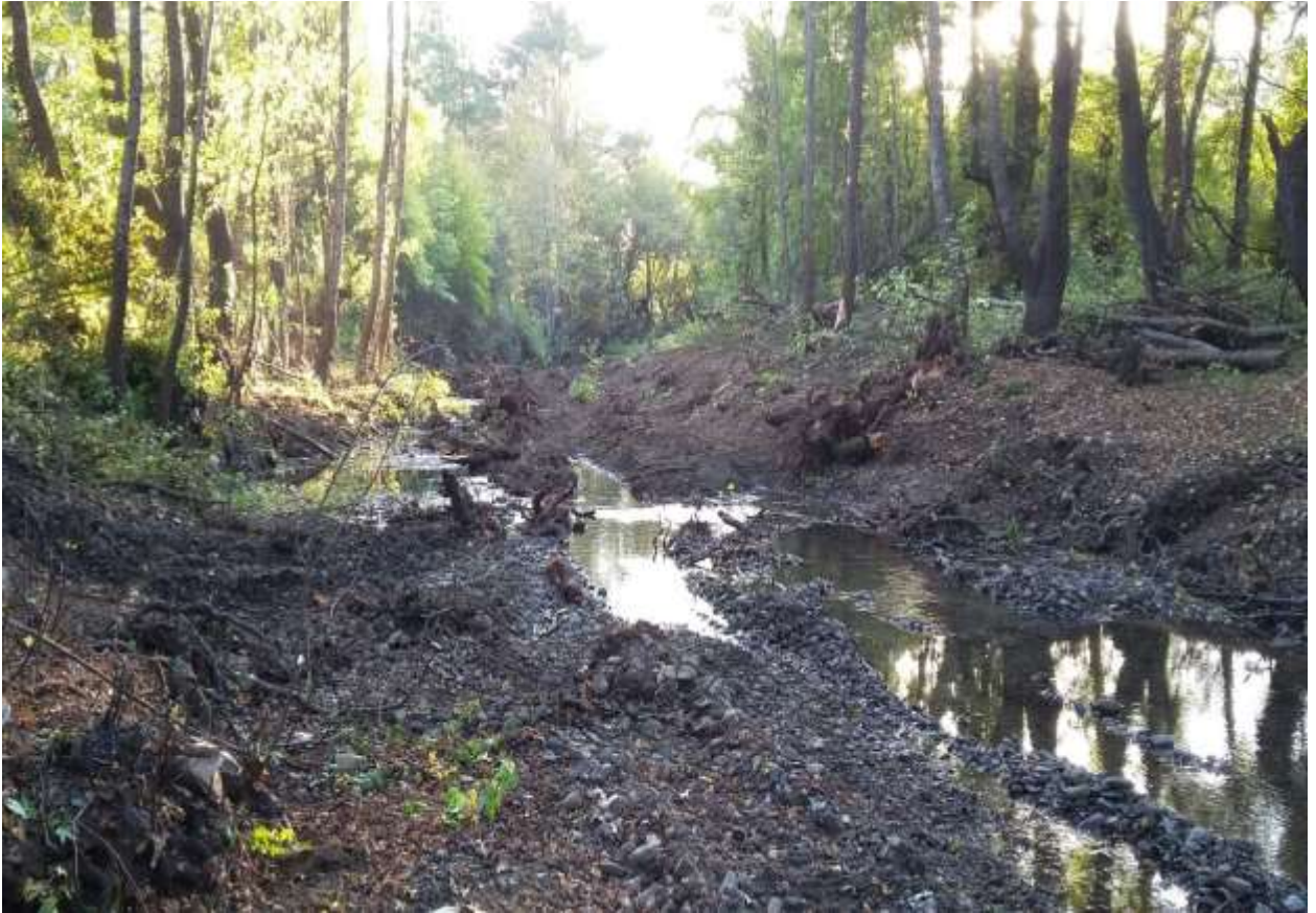
Fotoğraflar 10-11 : Ekskavatör ile yapılacak ıslah çalışması öncesinde dere yatağı içerisinde ağaç kesimi öncesi-sonrası