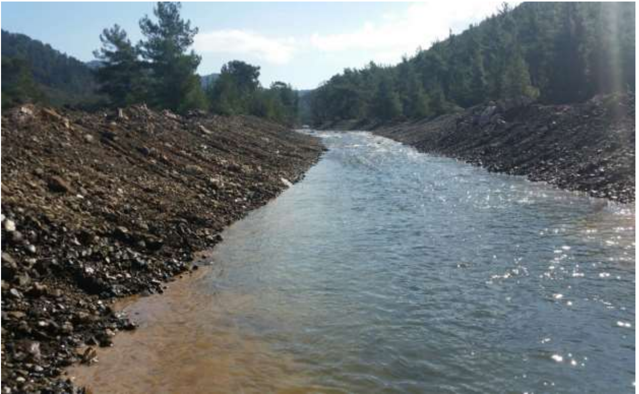
Fotoğraflar 5-6 : Dozer ile yapılan ıslah çalışmasının öncesi-sonrası