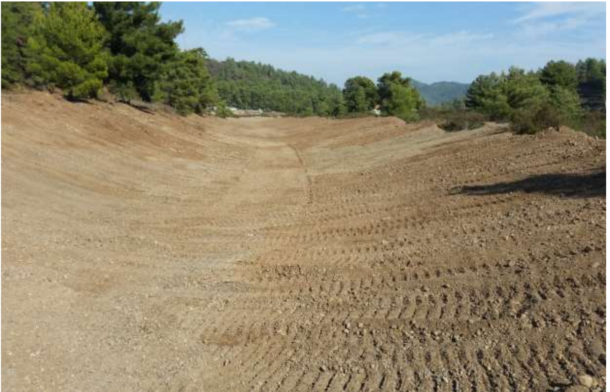
Fotoğraflar 7-8 : Dozer ile yapılan ıslah çalışmasının öncesi-sonrası