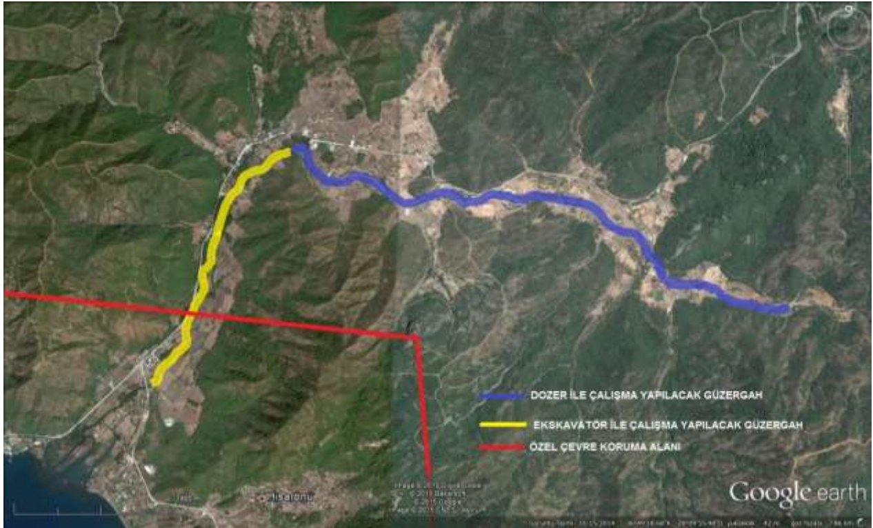
Uydu Fotoęrafı Görüntüsü-1: Çalıřma Bölgesini Gösterir Vaziyet Planı

Bu bağlamda, 2015 yılı içerisinde kış mevsimi öncesinde, Kazan Deresi'nde memba kısmından (Asparan Mevkii) mansaba doğru İdaremizce bir makineli çalıřma (dozer+ekskavatör) bařlatılmıřtır. Makineli ıslah çalıřması yapılması planlanan toplam güzergâh uzunluęu 9.700 metredir. Bu güzergâhın 6.380 metresi dozer ile 3.320 metresi ise ekskavatör ile yapılacak olup, her iki makine ile de tamamen yatak içerisinde çalıřma yapılması planlanmıřtır (Uydu Fotoęrafı Görüntüsü-1). Ekskavatör ile çalıřılacak 3.320 metrelik güzergâhında 1.250 metrelik kısmı "Özel Çevre Koruma Alanı" içerisinde kalmaktadır.